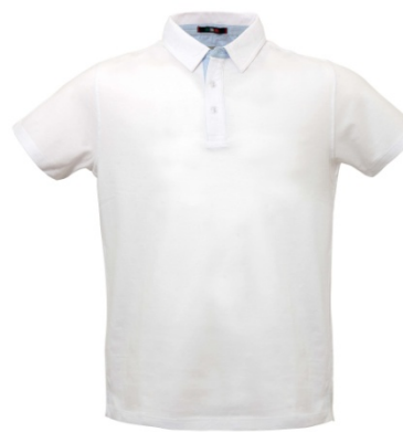
02 - WHITE