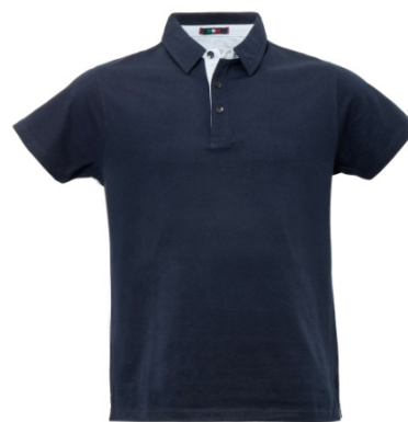
01 - BLUE