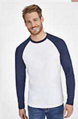
SOL'S FUNKY LSL 02942